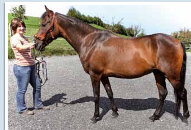
Dasselbe Pferd am 10.09.2009