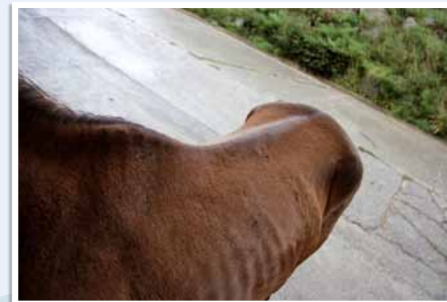
Therapiepferd bei der Anlieferung am 18.07.2009