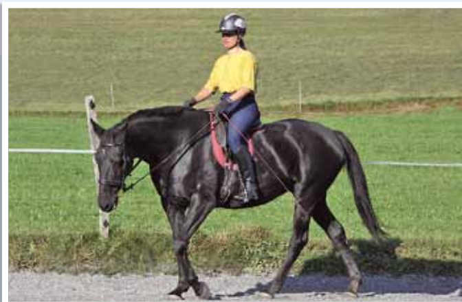
Unspektakulär, aber die Basis pferdegerechten Reitens: Die korrekte Dehnungshaltung bei aufgewölbtem Rücken