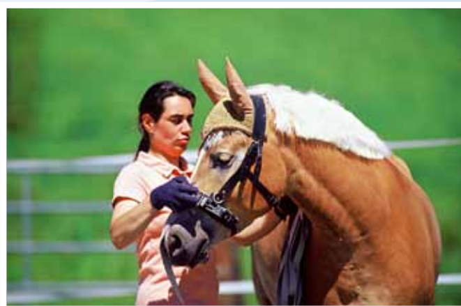
Gezielte Gymnastik stabilisiert oder verbessert den Gesundheitszustand